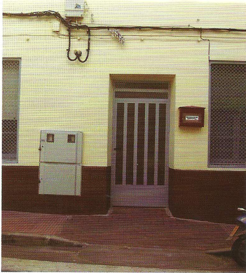
Entrada, sin barreras arquitectónicas, al Centro Social Municipal Polivalente "Sagrado Corazón" MOLINA DE SEGURA

E l pasado mes de Enero cumplimos dos años, desde que comenzamos con fuerza nuestra andadura como Asociación de Vecinos.. Dos años que han servido, así quedó de manifiesto en la Asamblea General, a la que asistieron invitados y participaron el Alcalde y el Concejal de Urbanismo y Medio Ambiente, de 5 de febrero pasado, para recuperar la identidad del barrio, para estimular nuestra autoestima ("si queremos, podemos"), para tener una sede (Centro Social) que nos dote de identidad física y sea lugar de encuentro para todos y todas los vecinos, para poner en marcha actividades culturales y deportivas que tod@s conocéis y para reivindicar los arreglos necesarios que mejoren nuestra calidad de vida.