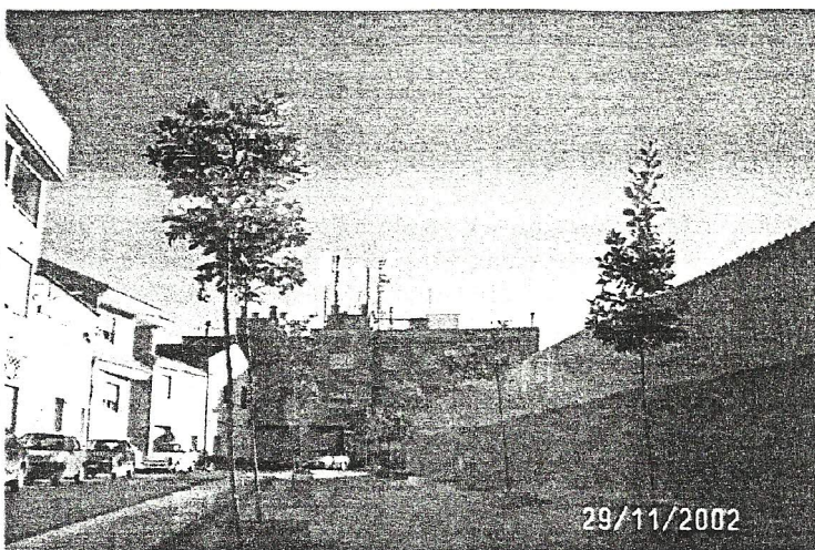
Las antenas vistas desde la calle Calderón de la Barca. La valla del Colegio Sagrado Corazón, a la derecha de la foto, muy cerca de las mismas.

Por último le comunico que la A.V. contrastará la información de los referidos documentos e informes y ateniéndose al "principio de cautela" y prevención de riesgos para la salud de las personas, utilizará, además, otras vías que contribuyan al desmantelamiento y alejamiento de las antenas referidas, aportando informes de otros técnicos, impulsando la aprobación de una ordenanza municipal al respecto, haciendo que se contemplen las medidas oportunas en el PGOU y adoptando cualquier otra medida dirigida a la ejecución del acuerdo de la Asamblea General, que es el sentir generalizado de los vecinos que vivimos en la zona, añadiendo la preocupación del riesgo que hay que asumir por la existencia en sus inmediaciones de "centros sensibles", centros educativos, utilizados por niños/as y personas mayores.