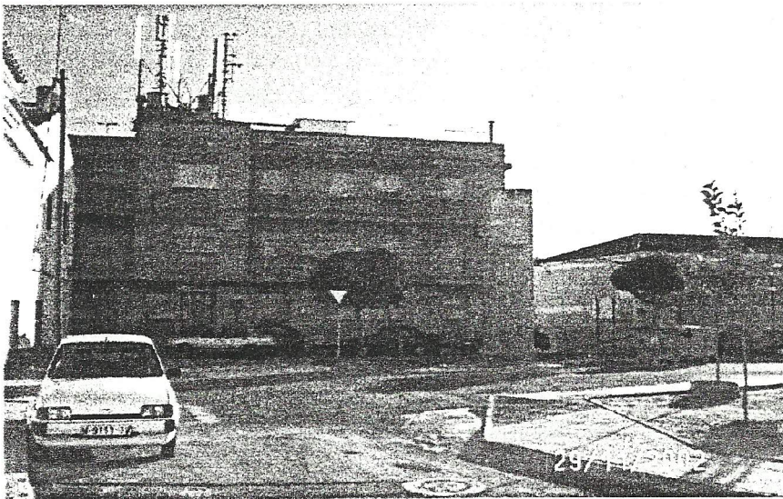
Las antenas en los pisos de la calle Cartagena, a la espalda de la iglesia, pegados al Colegio Concertado Sagrada Familia y a menos de 50 metros del Colegio Público Sagrado Corazón.

En segundo lugar, le ruego que por parte de los servicios jurídicos municipales y los técnicos correspondientes se emita y se nos remita el informe necesario que justifique y certifique que las citadas antenas cumplen o no cumplen todos los requisitos expresados en los documentos anteriores, así como la posibilidad de plantear un recurso en términos legales, que propicie su desmantelamiento por estos cauces.